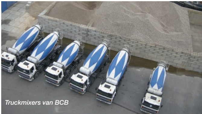
(vervolg van pagina 1 - Betonmortelbedrijven Cementbouw)

Alle gegevens komen samen in VOLUmEX, dat voorziet in de inkoop, verkoop, voorraad, planning, de administratieve afhandeling en de financiële rapportages. Deze processen worden gesynchroniseerd met gegevens uit het receptensysteem, de besturing van de centrales en het tracking systeem, dat ons aangeeft waar onze mixers zich precies bevinden. Efficiencyverbeteringen liggen dan ook voor de hand. Met leveranciers maken we centraal eenduidige afspraken die vanuit de behoeften van de individuele vestigingen ingevuld worden. Voorraadbeheer en controle op ingekochte grondstoffen en uitgaand product komen nu tot stand door het vergelijken van administratieve én productiegegevens. Alle opdrachtgevers hebben nu één aanspreekpunt waardoor de capaciteits- en transportplanning ook centraal aangestuurd kan worden”.